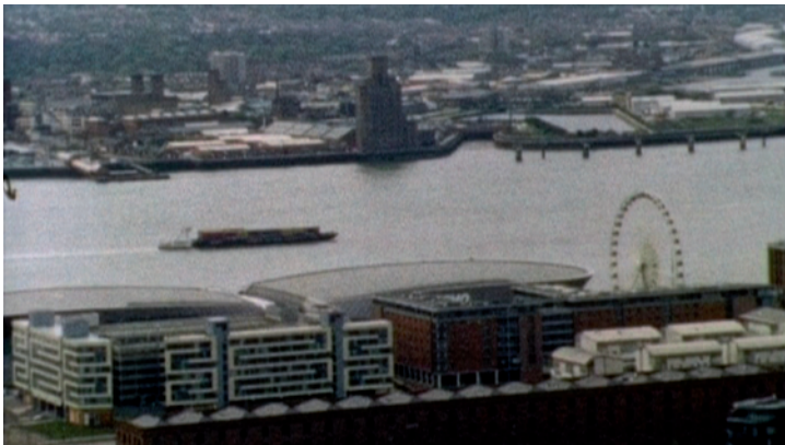
Extrait du film