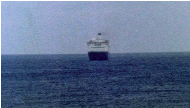
Extrait du film