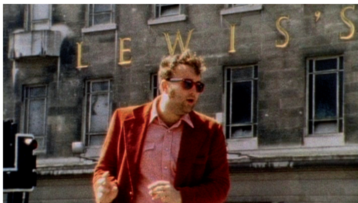
Extrait du film