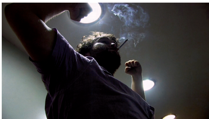
Extrait du film