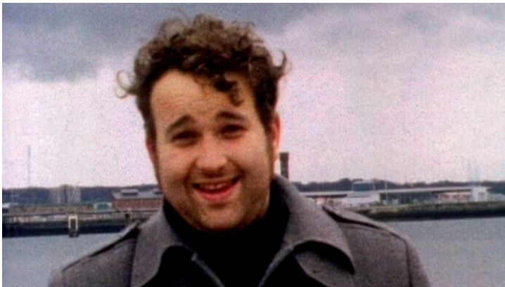
Extrait du film