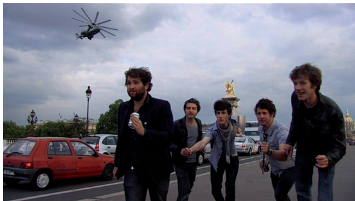
Extrait du film

Avant la sortie de son nouvel album, le groupe normand The Lanskies débarque au Owest Park, après son incandescent concert à Rock en Seine.