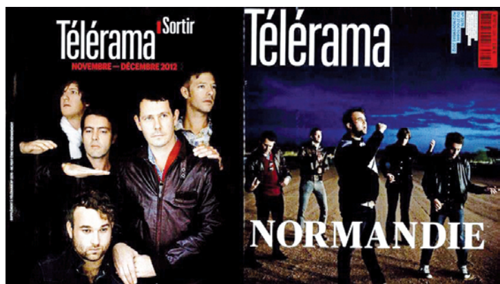
Couvertures de Télérama spécial Normandie Novembre / Décembre 2012